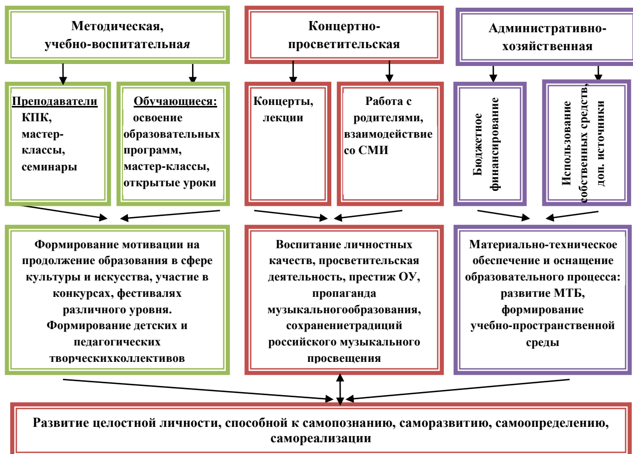
Рис.1. Уставные виды деятельности

Уставные цели: создание необходимых условий для личностного развития, укрепления здоровья, профессионального самоопределения и творческого труда детей (в возрасте преимущественно от 6 до 18 лет) и преподавателей школы.